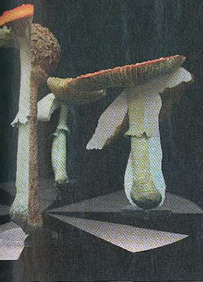
Carsten Höller Doppelpilzlehr (2010), exposé dans Soma