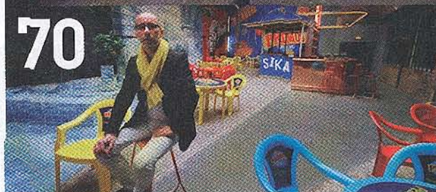
Linda Wjand/Quadrant News & Media Ltd 2008