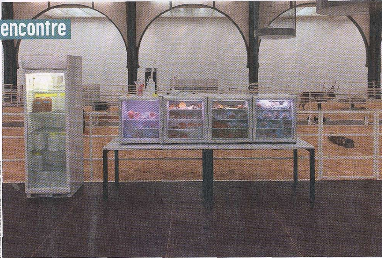
Carsten Höller

Urine de rennes et champignons psychotropes : une invitation au voyage