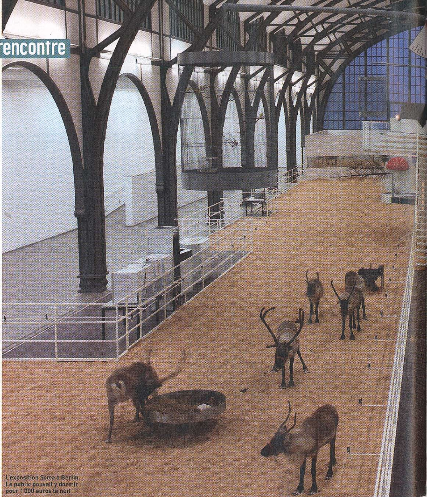
L'exposition Soma à Berlin. Le public pouvait y dormir pour 1 000 euros la nuit